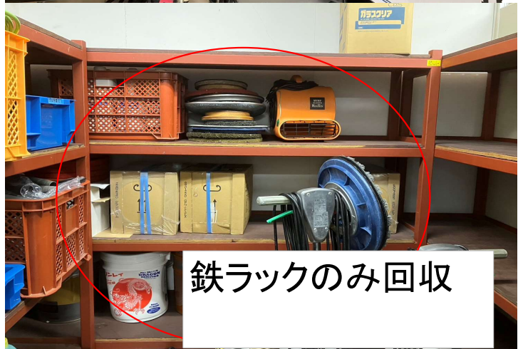
鉄ラックのみ回収