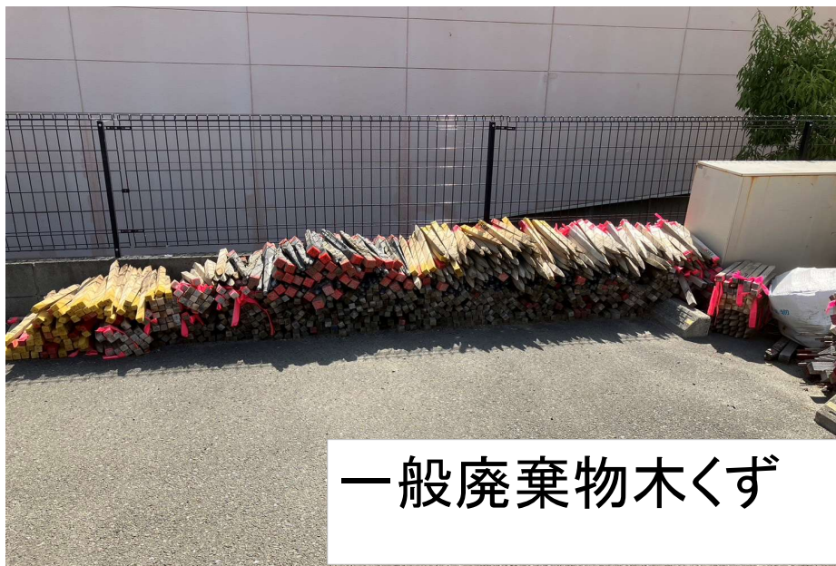
一般廃棄物木くず