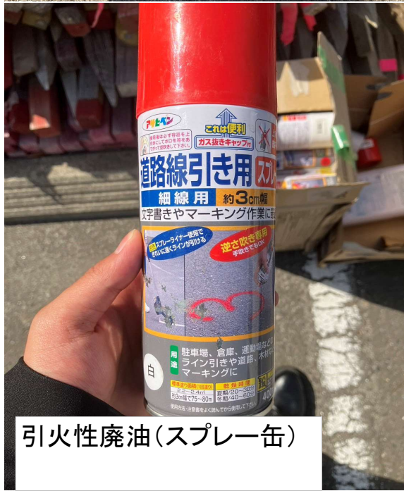
引火性廃油(スプレー缶)