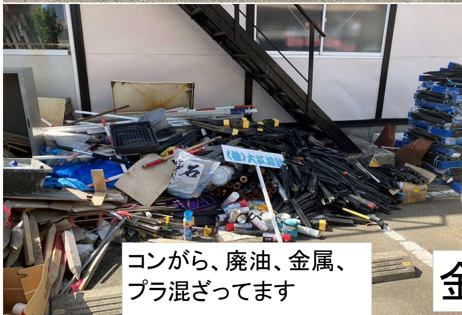
コンガラ、廃油、金属、 プラ混ざってます